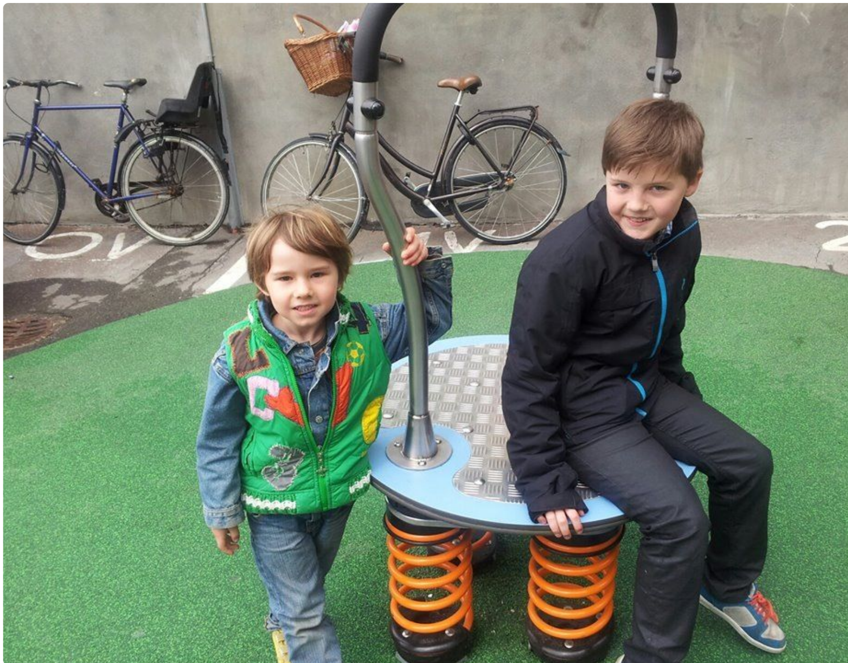
En legeplads kan stadig trække!